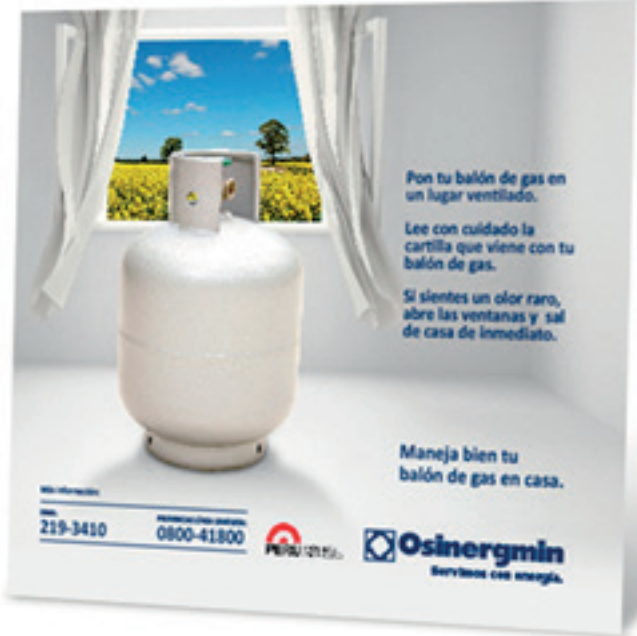
diseño, diagramación y arte finalización de aviso de revista y post redes sociales