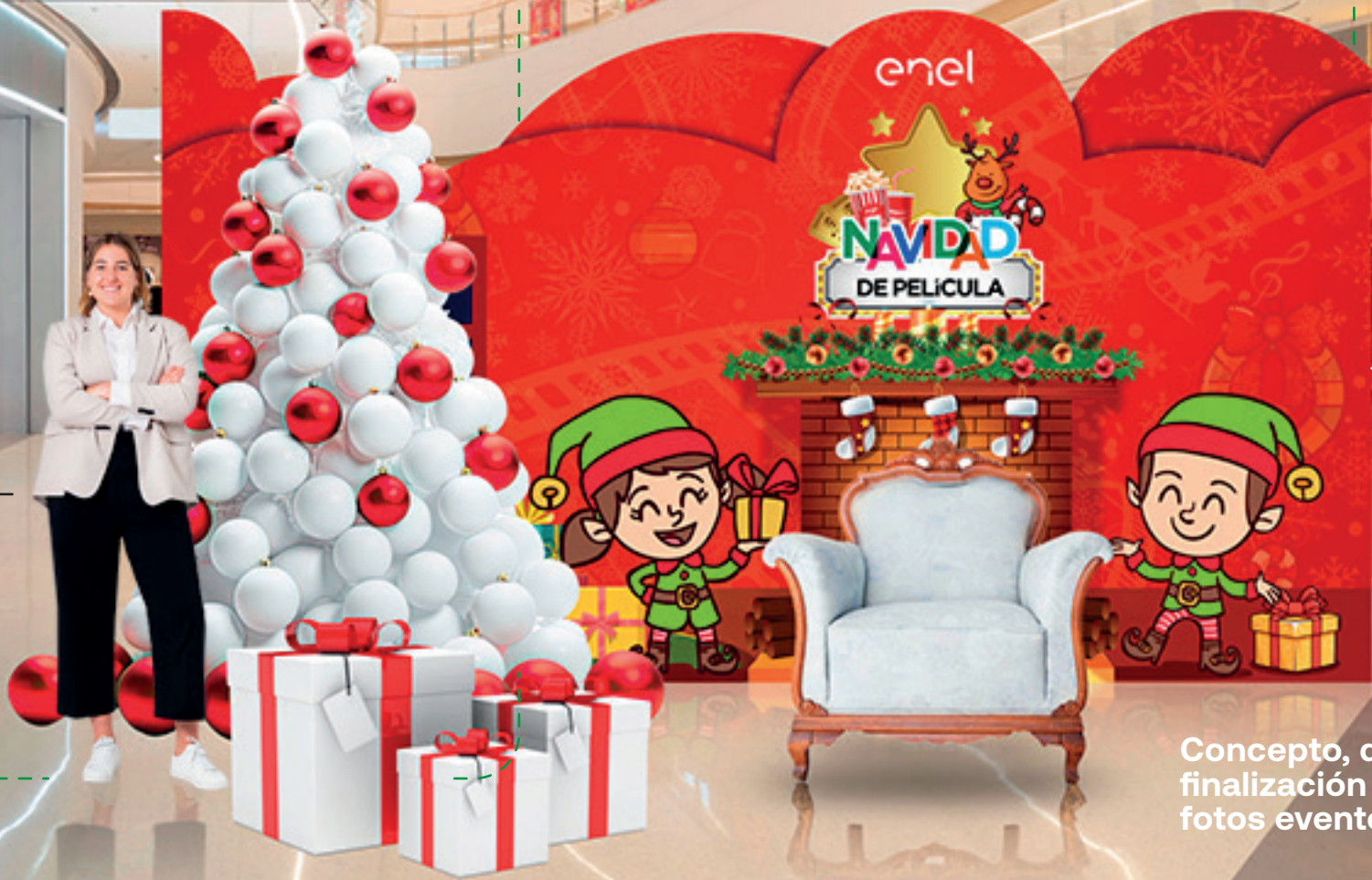
Concepto, diseño y arte finalización de backing de fotos evento corporativo