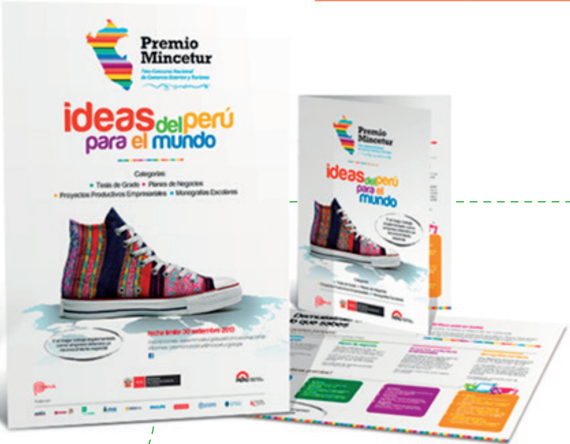
diseño y arte finalización de aviso de revista y material promocional